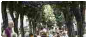
Trentino, in Valle di Cembra si celebra il Müller Thurgau dal 6 al 9 Luglio