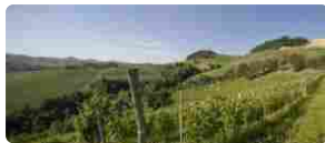
Estate nelle Langhe con Domenico Clerico