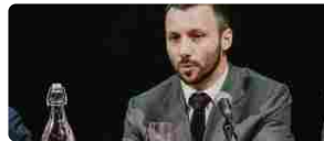
Nasce l'enoteca Rosso Morellino dedicata agli appassionati del Sangiovese della Costa Toscana