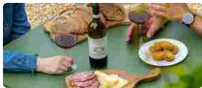
Brigaldara inaugura la Locanda in Case Vecie