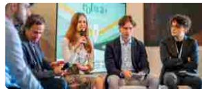
Trame di Vite: Il Conegliano Valdobbiadene Prosecco Superiore D.O.C.G. si racconta